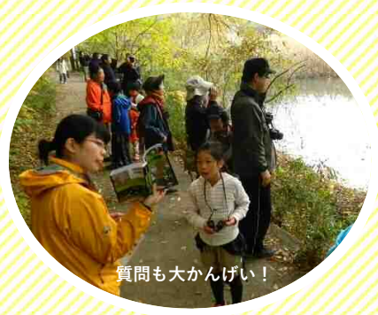
質問も大かんげい!