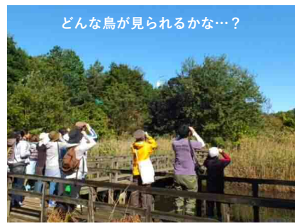
どんな鳥が見られるかな…?